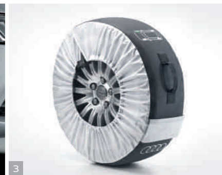
3 Чехол для упаковки колеса Состоящий из четырех чехлов комплект с удобными ручками обеспечивает удобную и чистую транспортировку и хранение колес в сборе. Из прочной полимерной ткани. Во внешних карманах можно хранить колесные болты.