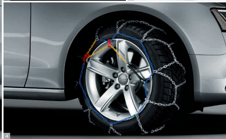
4 Цепи противоскольжения Для повышения устойчивости на снегу и льду. Например, для колес размером 225/50 R 17.