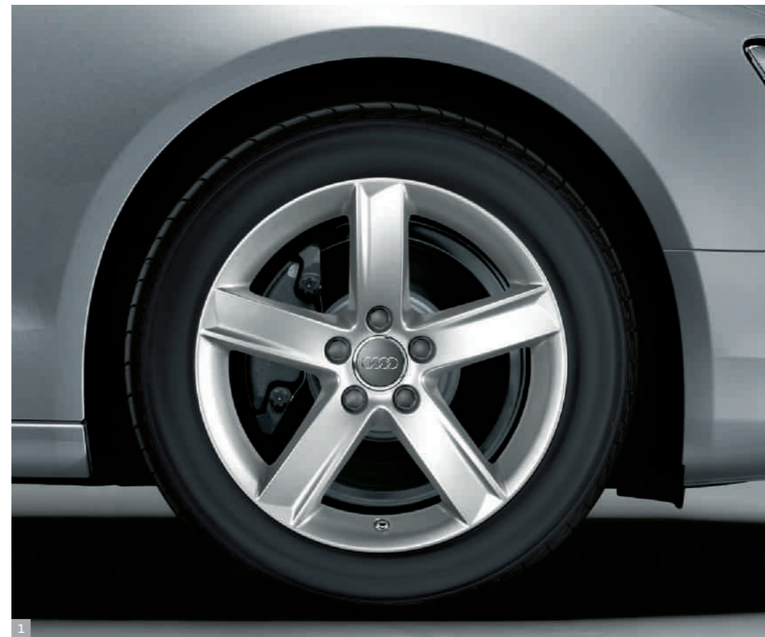
1 Зимние литые легкосплавные диски, дизайн «5 рукавов» Пригодное для установки цепей противоскольжения зимнее колесо в сборе, размер 7,5 J x 17 с шинами 225/50 R 17.