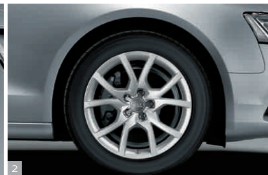
2 Зимние литые легкосплавные диски, дизайн «10 спиц» Зимнее колесо в сборе, размер 8,5 J x 18 с шинами 245/40 R 18