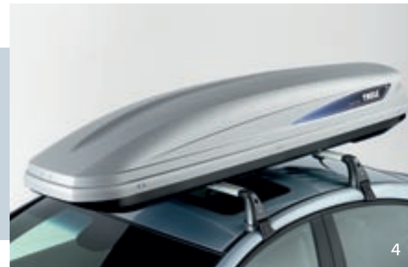
ТРАНСПОРТНЫЙ КОНТЕЙНЕР PACIFIC 200