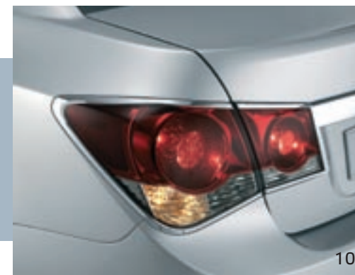
НАКЛАДКА НА ЗАДНЮЮ СТОЙКУ КУЗОВА