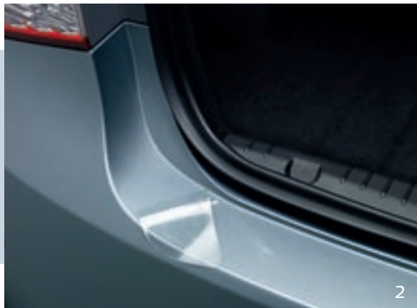
ЗАЩИТНАЯ ПЛЕНКА ДЛЯ ЗАДНЕГО БАМПЕРА