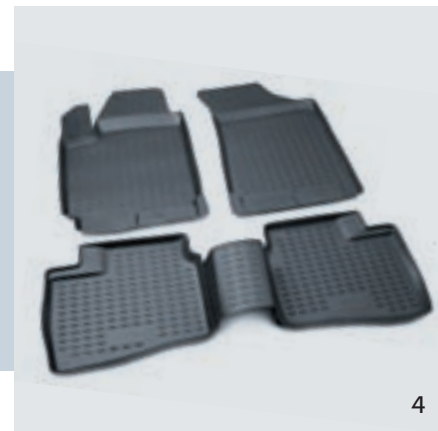
РЕЗИНОВЫЕ НАПОЛЬНЫЕ КОВРИКИ