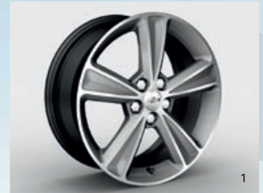
КОЛЕСО С 17-ДЮЙМОВЫМ ЛЕГКОСПЛАВНЫМ ДИСКОМ