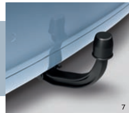
ЗАДНЕЕ КРЕПЛЕНИЕ ДЛЯ ПЕРЕВОЗКИ ВЕЛОСИПЕДОВ